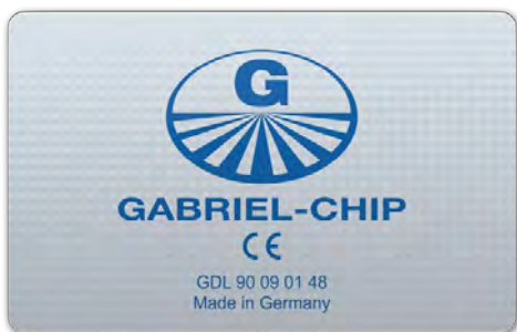
Anbringen des GDL 9048 am Hauptsicherungskasten

Bei Einbau der Gesamtlösung in Einfamilienhäuser bitte zusätzlich nachstehende Einbautips von DAKTI beachten!